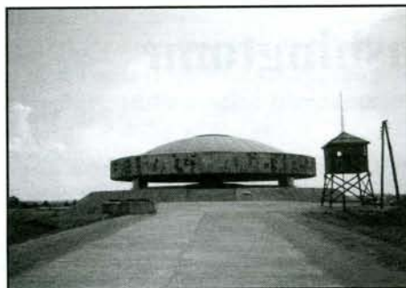
Mauzoleum s popelem zavražděných v Majdanku

Další zastávkou byla vesnice Trawniki sloužící od května 1942 jako tábor nucených prací především pro sovětské zajatce a polské židy. Vězňové pracovali na zemních pracích a v okolních továrnách. Do konce roku 1942 a v roce 1943 byli do Trawniků deportováni židé z různých polských ghetta a dostali se tam i židé z dalších zemí. Po povstání ve vyhlazovacím táboře