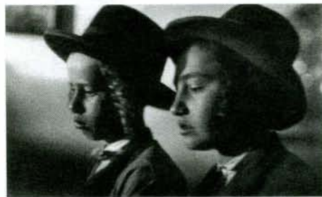
Chlapci z chederu na Podkarpatské Rusi, kolem 1930