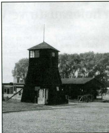
U vchodu do tábora Majdanek je pro žízňivé návštěvníky „vkusně“ instalován automat na Coca - Colu.

danku zachované plynové komory, krematorium a řada táborových baráků. V několika blocích jsou instalovány výstavy seznamující návštěvníky s historií tábora. Jedna z vystavených fotografií zachycuje i příjezd transportu do Terezína. V jednom z bloků jsou vystaveny statisíce párů bot