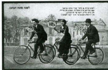
Novoroční přání, Varšava, kolem 1910

Pro případné zájemce uvádíme e-mailovou adresu Terezínské iniciativy: terezinskainiciativa@gmail.cz