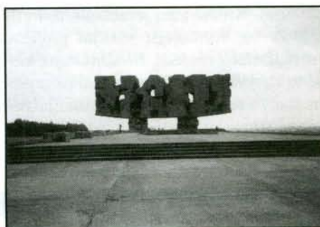
Pomník zavražděným v Majdanku

hynulo 360 tisíc lidí, z toho dvě třetiny židů. Ostatní byli Poláci a ruští zajatci. Z Terezína přijely do Majdanku dva transporty po 1000 lidech, vypravené 25. května a 13. června 1942.