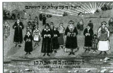
Novoroční obřad tašlich na břehu řeky, Rakousko-Uhersko, kolem 1910