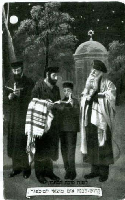
Novoroční přání – požehnání měsíce na závěr Jom kipuru, Německo, kolem 1910