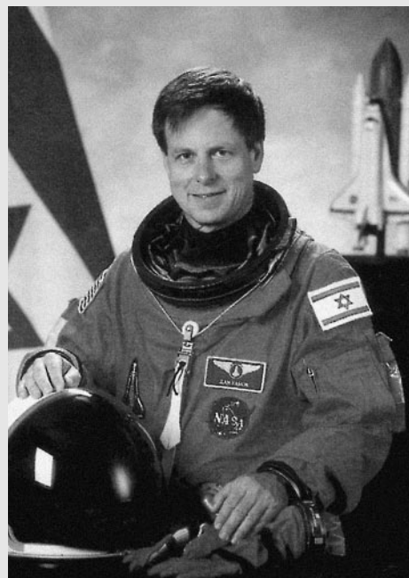
První izraelský kosmonaut plk. Ilan Ramon