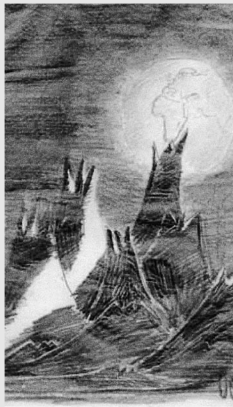
Petr Ginz: Pohled z Měsíce na planetu Zemi, kolem roku 1942, kresba tužkou, tuší, štětcem, 14,5 x 21 cm