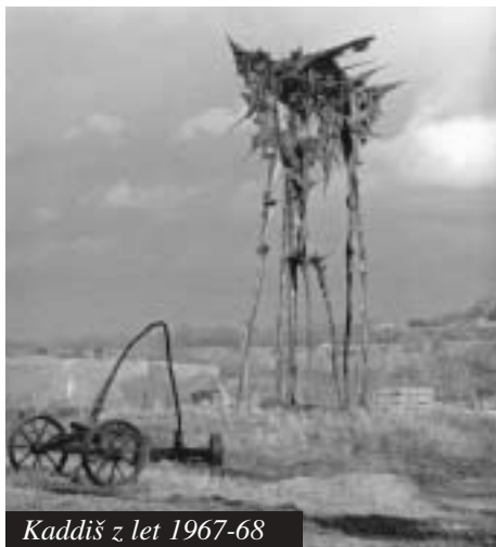
Kaddiš z let 1967-68