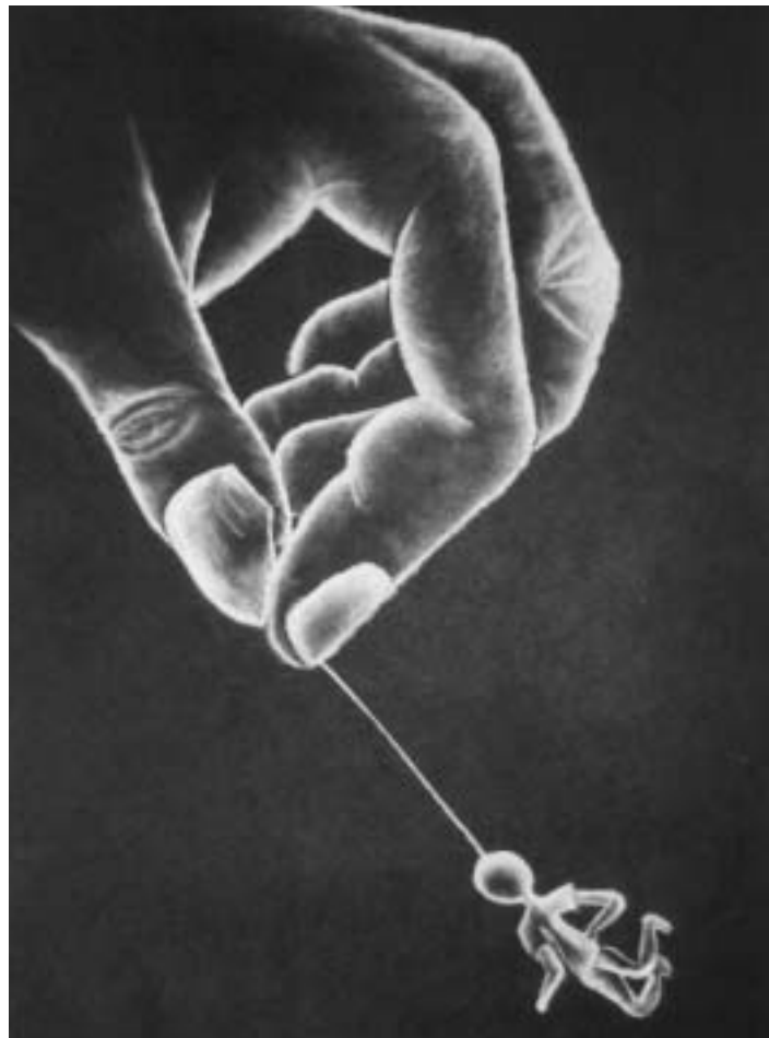
Kde je svoboda?