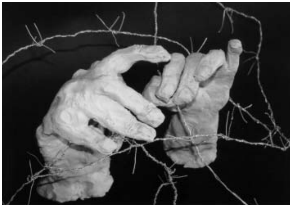
▲ Ruce v ostnech kolektivní práce