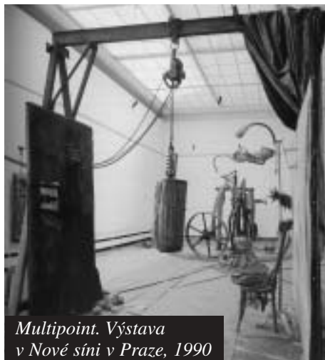
Multipoint. Výstava v Nové sni v Praze, 1990