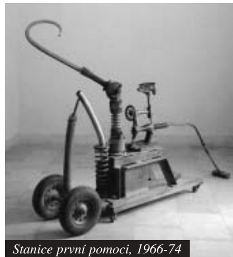
Stanice první pomoci, 1966-74