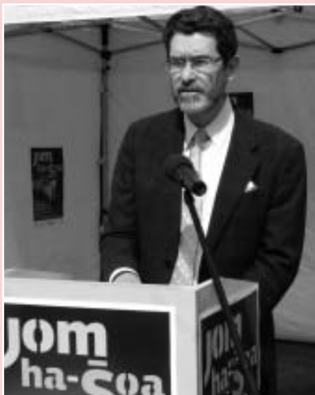
Norman Eisen, velvyslanec USA