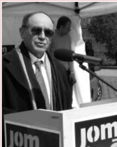
Jaakov Levy, velvyslanec Státu Izrael