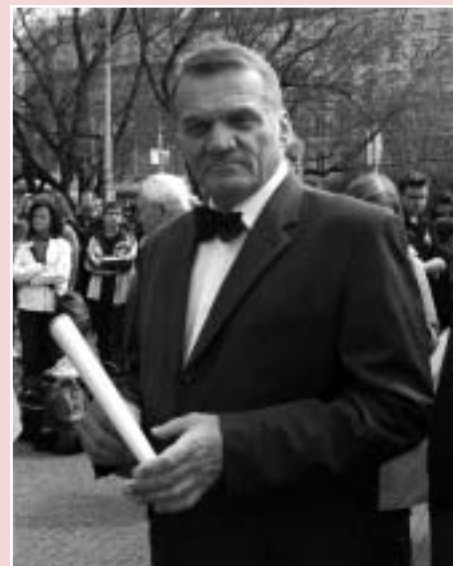
Bohuslav Svoboda, primátor hlavního města Prahy