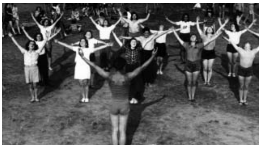
Hagibor v roce 1941

V minulém čísle našeho časopisu jsme přinesli reportáž z odhalení pamětní desky, která připomíná osud někdejšího Hagiboru a na jehož místě dnes stojí Rádio Svobodná Evropa. Při této příležitosti jsme vyzvali vás, milí čtenáři, abyste nám napsali pár řádek na téma Jak si vzpomínám na Hagibor . Mozaiku vzpomínek máte dnes před sebou.