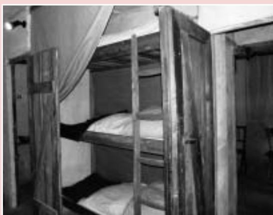
Nová expozice v Památníku Terezín