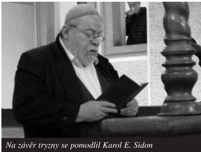
Na závěr tryzny se pomodlil Karol E. Sidon

Já vím. Ti „zářijoví“ tenkrát nevěděli, nemohli vědět, že tato slova už pro ně neplatí. I oni tehdy ještě měli naději. Tu naději, která jak blikající paprsek světla nám, šťastným, umožnila ještě přežít. Těm zářijovým ten paprsek zhasl. Přeživším zbyly vzpomínky. My žijeme, abychom mohli vyprávět - a varovat. Varovat ty, kteří už nevědí, a především ty, kteří nechtějí vědět. Jsou události zapomenutelné. Jsou jiné, které