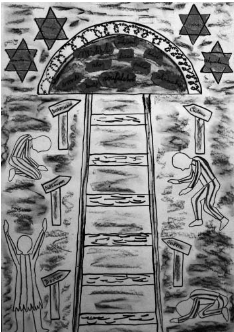
Kolektiv žáků 5. třídy ZŠ Lipence u Loun

A najednou se mezi všemi těmi odloženými věcmi vynořilo cosi, z čeho jí zamrazilo... Tak silně na ni nezapůsobilo ještě nic. Pod několika starými kastroly srovnanými do sebe,