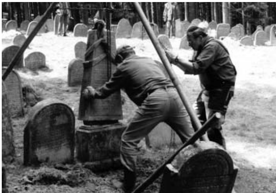
...muži pomocí železné trojnožky vztyčili povalené náhrobky...