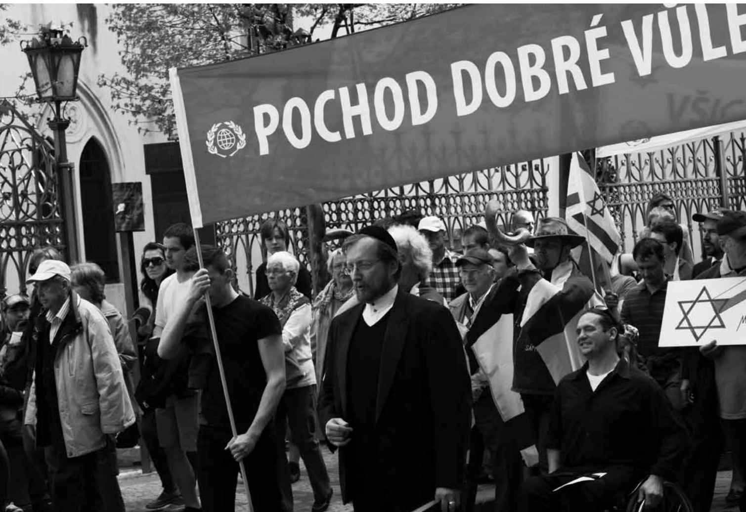
Pochod dobré vůle před Maiselovou synagogou