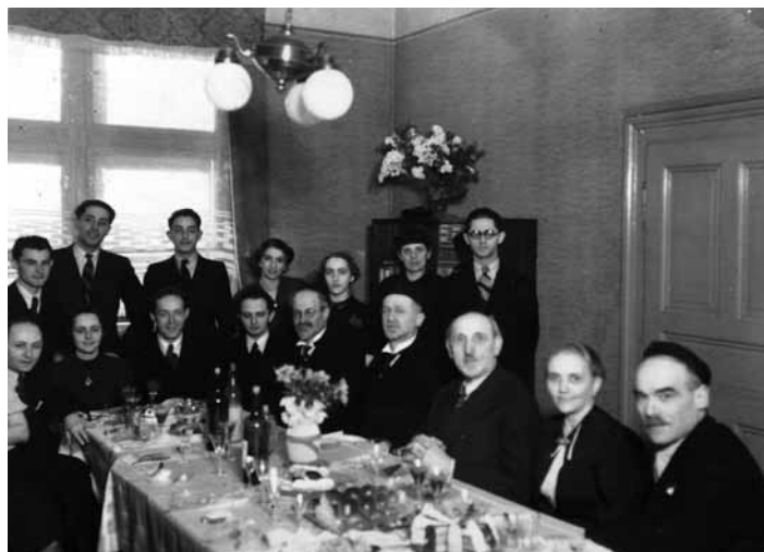
Na návštěvě u rabína Sichera