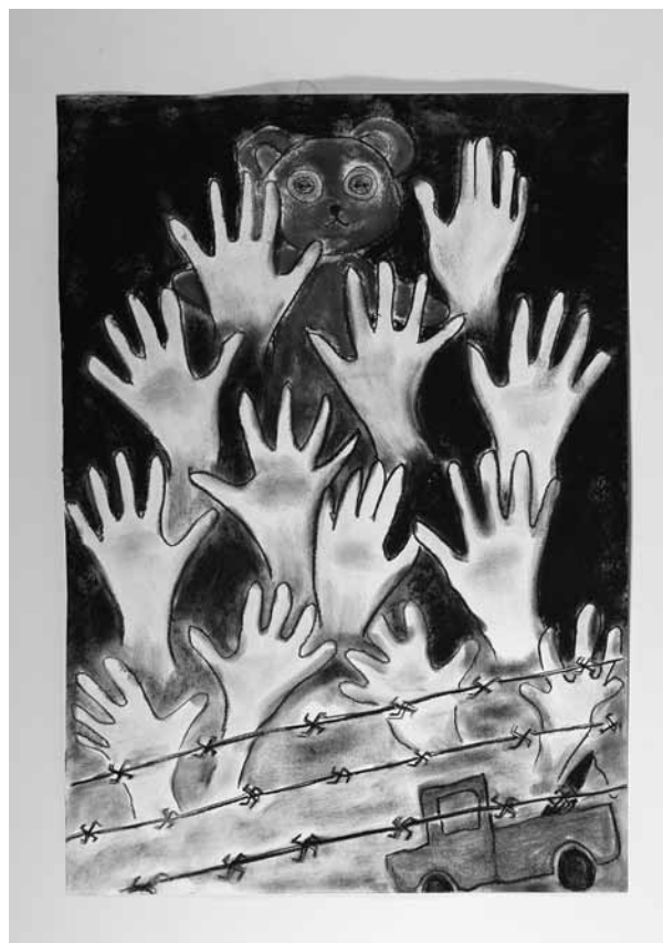
Beáta Žieziová a Lukáš Lečbych: Kéž bychom už nikdy nemuseli odejít... 10 a 11 let, Základní škola praktická a Základní škola speciální, Praha 5 - Lužiny