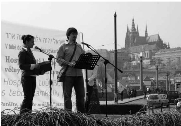
Na náměstí J. Palacha