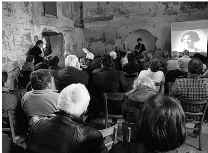
...„Zahájila jsem vyprávění promítáním fotografií čtyřleté holčičky“...