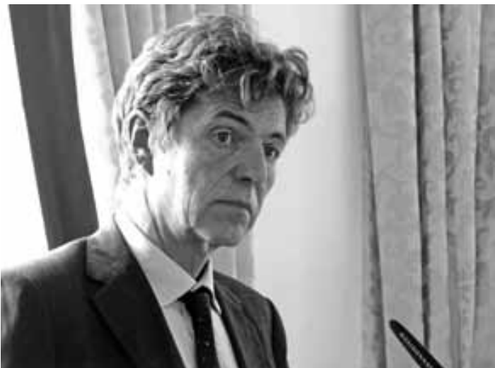
Velvyslanec SRN při projevu