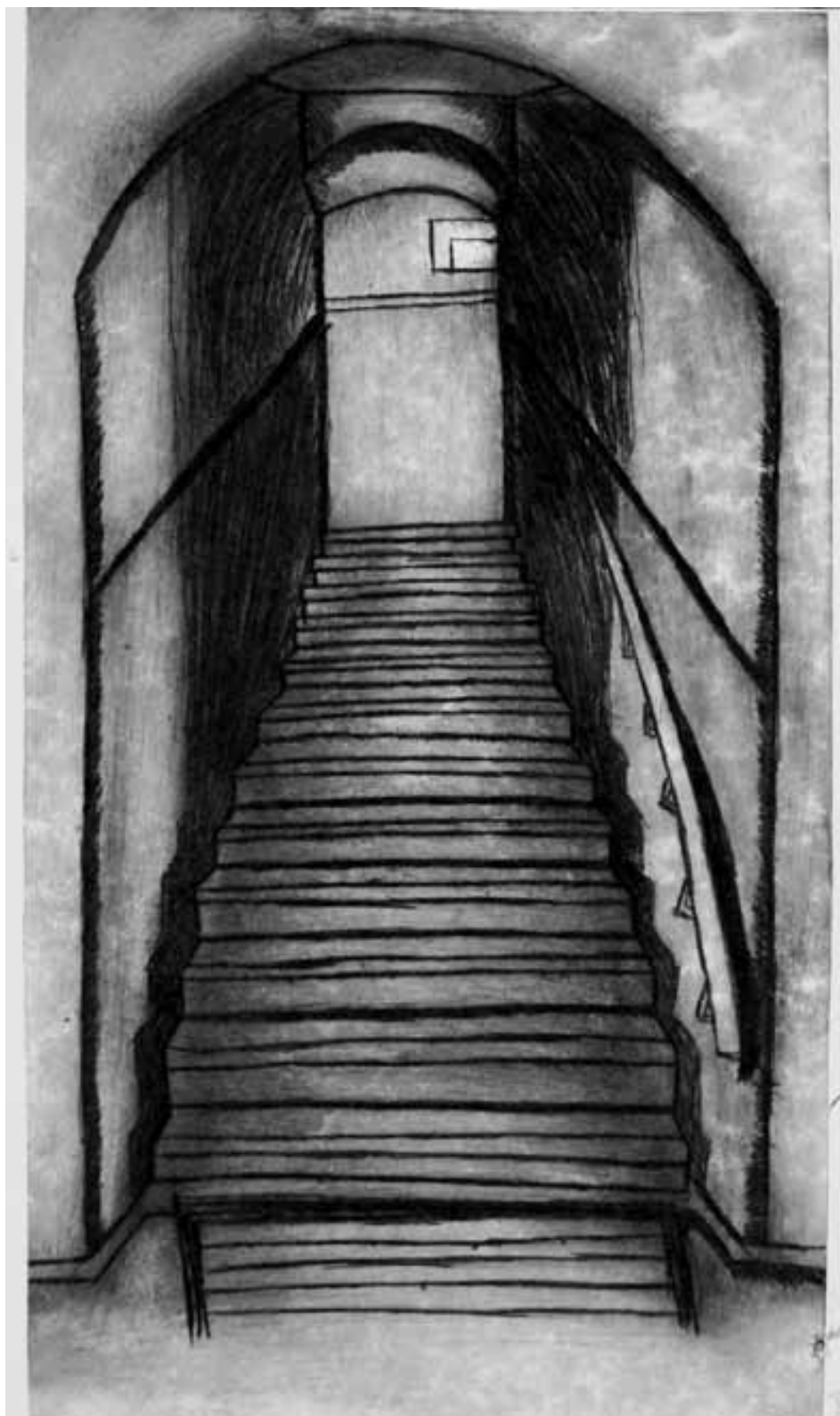
Sabina Pešková: Schody, 14 let, Gymnázium Frýdlant

A tak jsem se otočil a šel zpět na své místo k lavičce. Pořád jsem ale nemo-