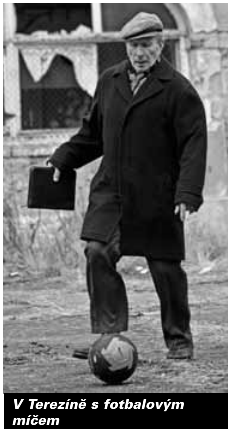
V Terezíně s fotbalovým míčem

odchodu z této funkce se velmi aktivně podílel na činnosti TI jako pamětník a spolupracoval s dalšími organizacemi, s Přírodní školou, s ICEJ, s PT, s ŽMP. Ale nejen proto ho budeme postrádat. Chybět bude hlavně kamarád, člověk s charakterem, vlídný a plný porozumění pro jiné.