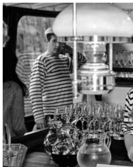
Posádka lodi Nepomuk