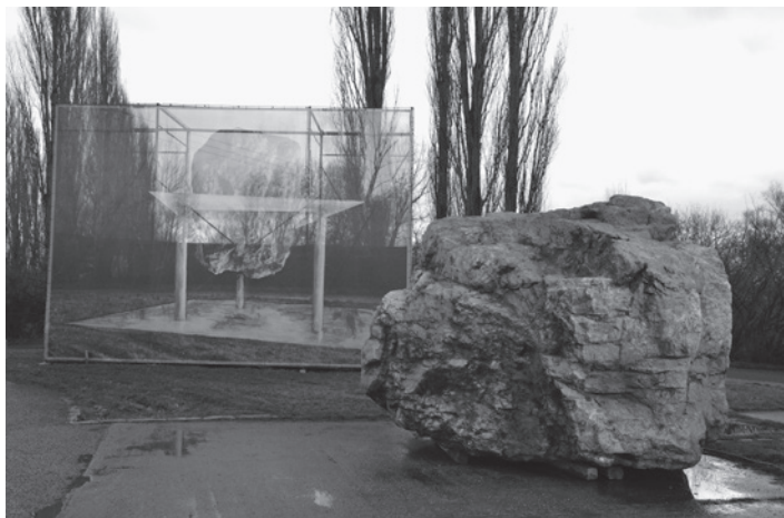
Památník obětem 2. světové války