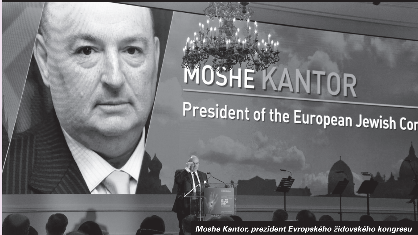
Moshe Kantor, prezident Evropského židovského kongresu