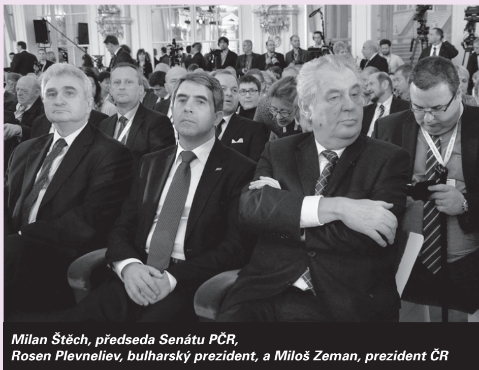
Milan Štěch, předseda Senátu PČR, Rosen Plevneliev, bulharský prezident, a Miloš Zeman, prezident ČR

V duchu Mezinárodního dne památky obětí holocaustu se projevy všech podobaly jako vejce vejci. Vyjadřovaly potřebu zabránit opakování holocaustu. Pouze prezident Zeman přinesl v projevu nový pohled, varování před Islám-