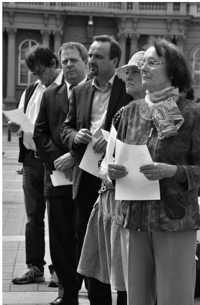
Na místo u mikrofonu čekali lidé trpělivě několik minut