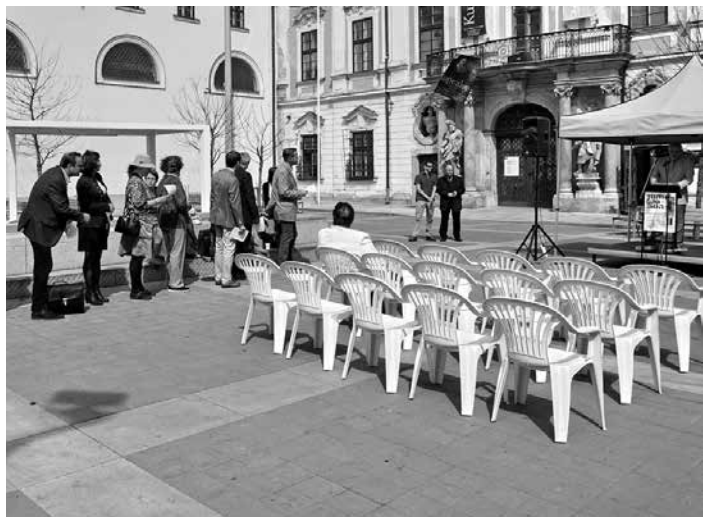
Na brněnském Moravském náměstí se pietní shromáždění letos konalo již podruhé

Na brněnském Moravském náměstí se letos konalo již podruhé. Iniciátorem a hlavním pořadatelem akce je Institut