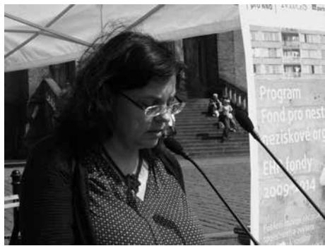
Michaela Marksová