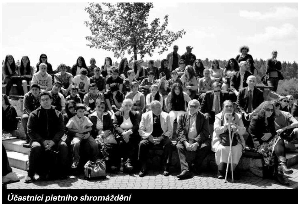
Účastníci pietního shromáždění

Závěrem vystoupil česko-romský dětský orchestr.