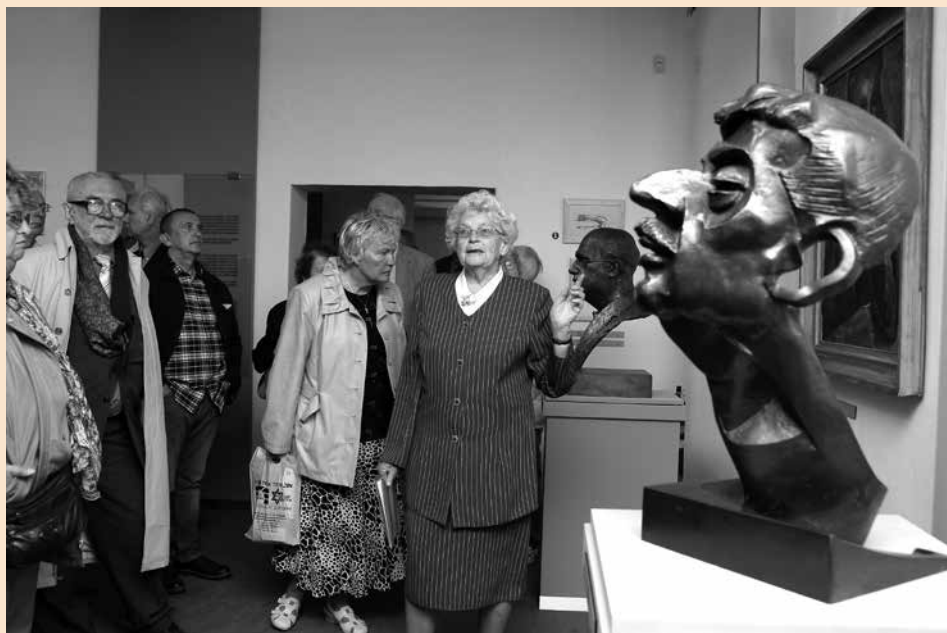
Z vernisáže výtvarné expozice České umění proti fašismu

komponovaný pořad hudby, filmu a vyprávění o vrcholných dílech 15 skladatelů, kteří byli za okupace vězněni v Terezíně. Autorem pořadu je Murry Sidlin. Zazněly známé i méně známé skladby, celý pořad vyžadoval značné soustředění, neboť všechny mluvené části byly v angličtině a rovněž uváděné hudební ukázky, zejména v první části, byly náročné na poslech. Velice působivý byl závěr první části koncertu, kdy orchestr ve filmu za řízení Karla Ančera a skutečný orchestr pod taktovkou Murryho Sidlina hrály současně skladbu Pavla Haase a publikum na plátně a publikum v jízdárně společně aplaudovalo.