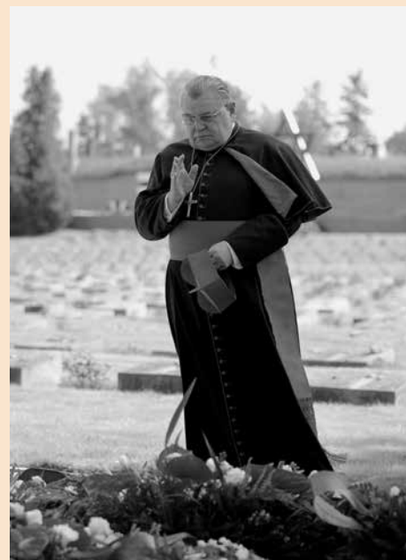
Kardinál Dominik Duka