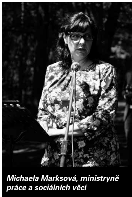
Michaela Marksová, ministryně práce a sociálních věcí

Obvykle čteme na stránkách našeho časopisu zprávy o tryznách, které se konaly jako vzpomínky na židovské oběti. Židé nebyli jediní, kterým byl jejich osud spojen s koncentračními tábory a vyhlazením, byli to i Romové a Sintové. Sdíleli stejný osud.