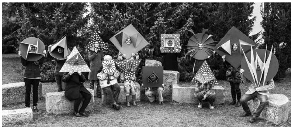
„Koukáme skrz díry v kloboucích.“

(Tereziánská pohádka, hrají Ochošní Suchdolníci, benefiční představení pro Cestu domů)