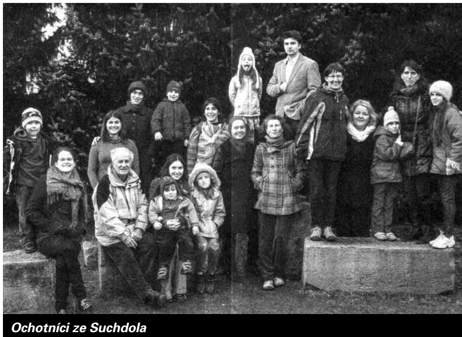
Ochotníci ze Suchdola