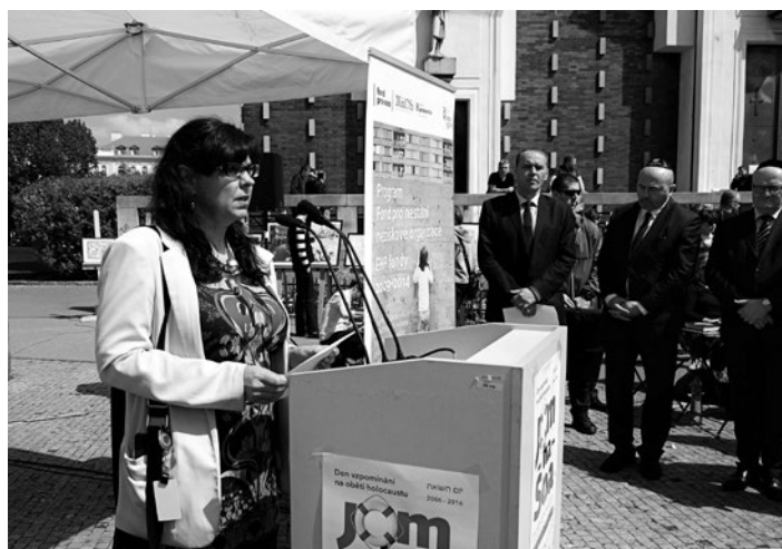
Michaela Marksová, ministryně práce a sociálních věcí