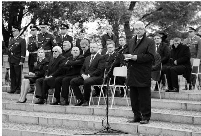
Milan Štěch, předseda Senátu Parlamentu ČR

Samozřejmě za žádných okolností neschvalují lynč ani samozvané mstitelé. Ty koneckonců neschvalovala ani tehdejší oficiální československá reprezentace. Například během květnového povstání v r. 1945 se v pražském rozhlase opakovaně zdůrazňovalo, že nikdo nemá individuální právo