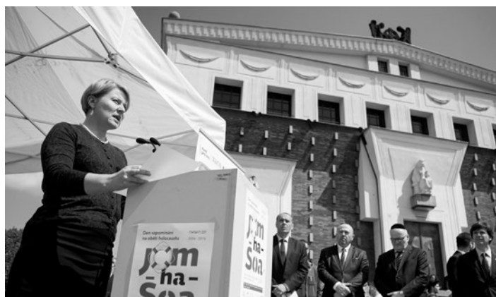
Vladislava Hujová, starostka Prahy 3