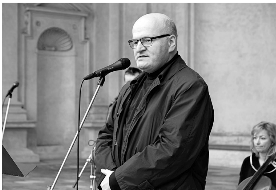
Daniel Herman, ministr kultury