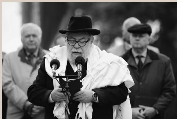
Karol Sidon, vrchní zemský rabín

Terezín je důkaz toho, jak jsou i některé skutky občas relativní. Většina těch, co přišli sem do Terezína, okusila nacistickou krutost už dávno předtím. Přesto pak v Terezíně na ten život venku vzpomínali jako na ráj na zemi ve srovnání s tím, co prožívali tady. A když se pak mnozí z nich dostali do Osvětimi, možná pro ně byl rájem na zemi zase Terezín.