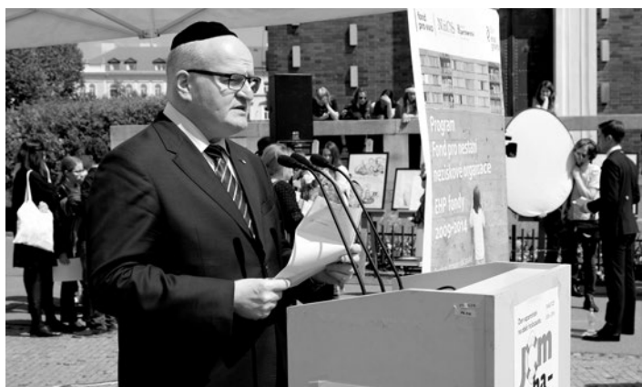
Daniel Herman, ministr kultury