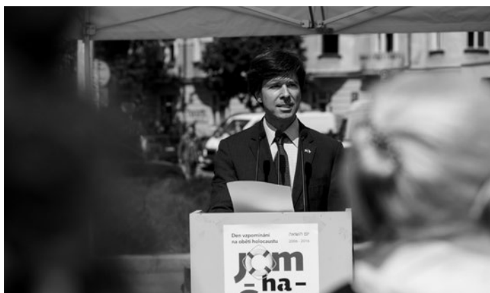
Andrew Schapiro, velvyslanec USA