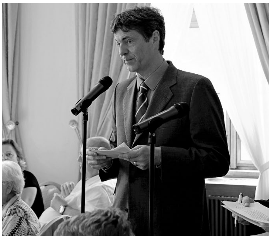
Velvyslanec SRN při projevu