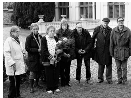
Delegace TI na Židovském hřbitově