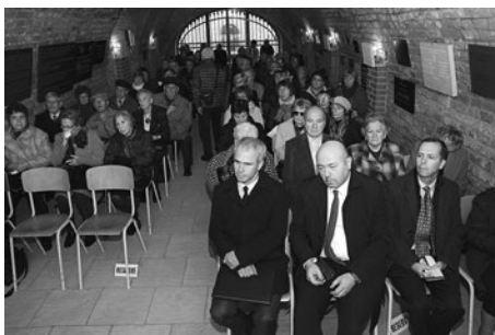
Posluchači v Kolumbáriu