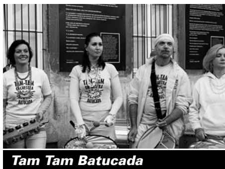
Tam Tam Batucada