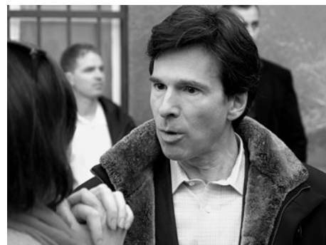
Andrew Schapiro, velvyslanec USA