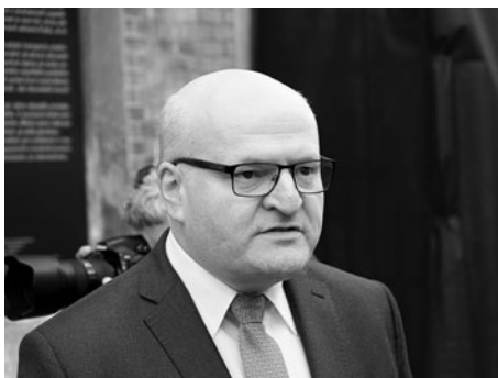
Daniel Herman, ministr kultury