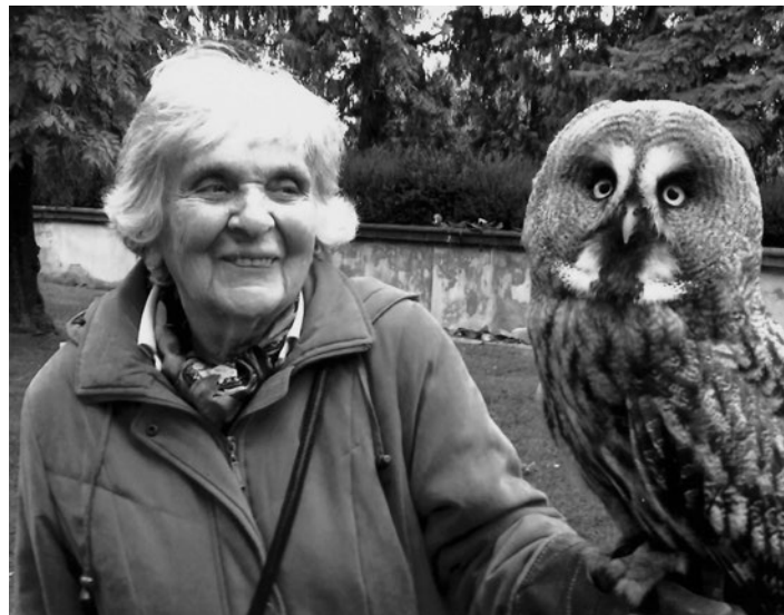
„Zmoudřelá věkem“ s moudrou sovou (2016)

Vrátila bych se k momentu, kdy jsem odmítala se svou milovanou babičkou hovořit německy. Další válečné události