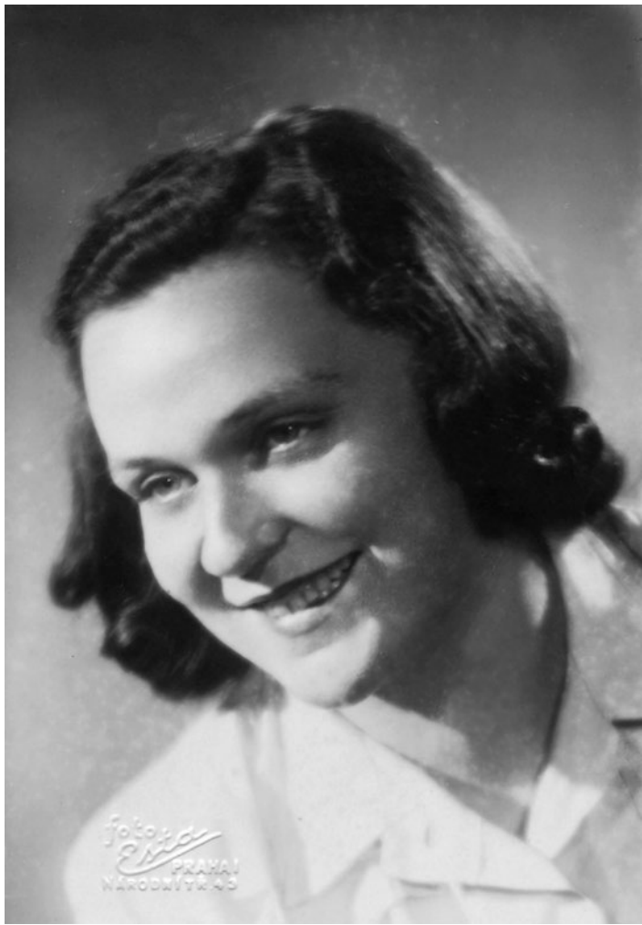
Maturitní fotografie (1947)

složit doplňovací zkoušky za promeškaná léta, což se stalo a já mohla postoupit do normální oktávy. Nejhorší známku jsem dostala z chemie (3), a právě ta se stala předmětem mého celoživotního zájmu a lásky. Po maturitě jsem se přihlásila na Přírodovědeckou fakultu Univerzity Karlovy, kde už od 2. ročníku jsem pracovala na Katedře analytické chemie jako pomocná vědecká síla a působila pak po celý svůj profesní život. Těší mne, že tyto vazby přetrvávají dodnes a že moji žáci se významně uplatnili jak v odborných kruzích, tak na důležitých řídicích postech.