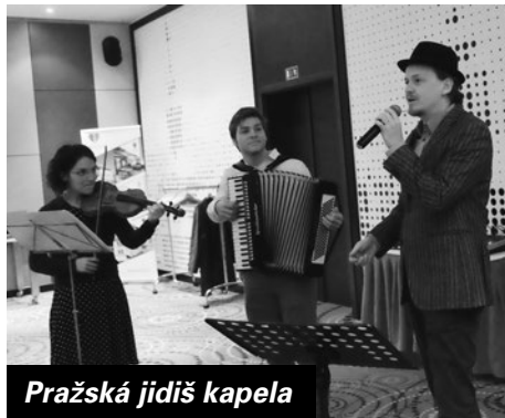
Pražská jidiš kapela