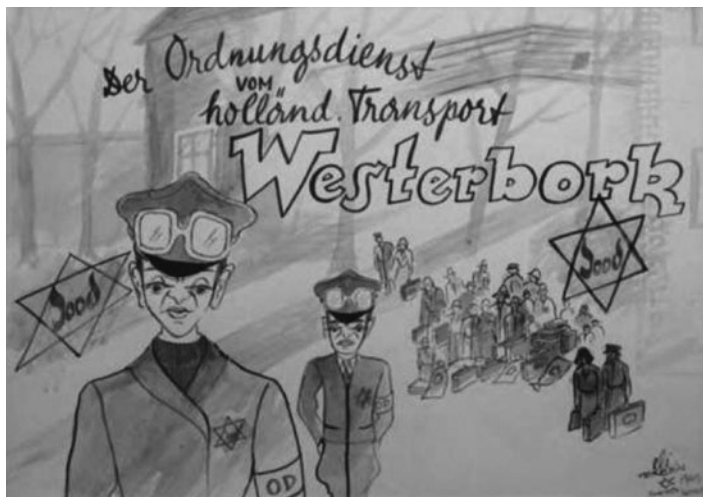
Obr. 18 – Židovská pořádková policie z transportu tábora Westerbork, Holandsko.

Lesklého komentář: „Skupina deportovaných židů je transportována do Terezína z koncentračního tábora Westerbork. Dva holandsští židovští policajti vpředu mají přes vojenské čepice nasazeny ochranné brýle.“