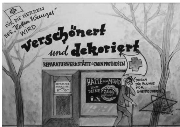
Obr. 21 – Pro pány z Červeného kříže (vše je zkrášleno a nazdobeno); (pro židy z ghetta u květin): opravářská dílna umělého chrupu; přijeti 8.00 – 16.00; (nápis na okně: drž hubu a své zuby zdravé)