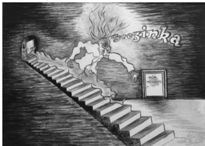
Obr. 13 – Terezínka. (nápís na dveřích) Pro muže

Kdokoli jste byli, sionista, český nacionalista, křesťan nebo ortodoxní žid, byli jste židem dle narození a byli jste za to trestáni. Žid byl povinen, v souladu s výnosem z února 1942,