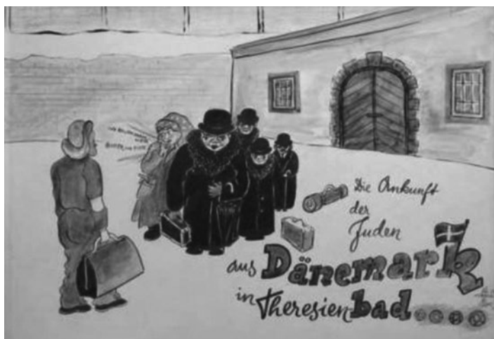
Obr. 19 – Příjezd židů z Dánska do „terezínských lázní“ ... „Kde se zde dá koupit máslo a vejce?“

Lesklého komentář: „Skupina deportovaných židů je transportována do Terezína z koncentračního tábora Westerbork. Dva holandsští židovští policajti vpředu mají přes vojenské čepice nasazeny ochranné brýle.“