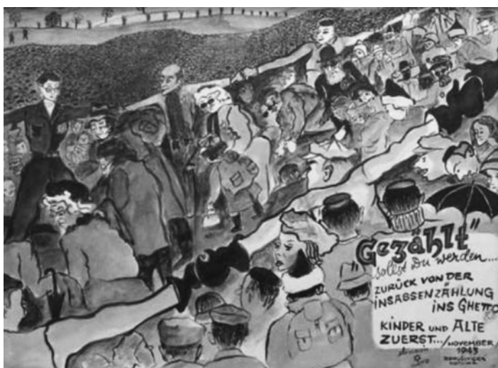
Obr. 16 – Sčítání přítomných: „Musíte být započítán.“ ... Zpět ze sčítání – do ghetta! Nejdříve děti a staří lidé ... listopad 1943, Bohušovické údolí

Seznamy byly pravidelně obměňovány a jména byla přenášena na jiné seznamy: na deportaci do Osvětimi. Pokud je známo, nikdo z „kriminálníků“ nepřežil. Za „vážné přečiny“ bylo potrestáno celé město. Bylo zakázáno rozsvěcet světla a být na ulicích po 18. hodině, tento zákaz platil i pro kulturní aktivity. 11. listopadu 1943 musela veškerá populace ghetta, kromě nemocných, napochodovat vně hranic ghetta, do bohušovického údolí. Nacistický velitel se doslechl zvěsti o uprchlých vězňích a rozhodl se přepočítat všechny vězně. Zabralo to 12 hodin. Byl zjištěn podvod (na seznamech bylo 30 fiktivních jmen místo jmen uprchlíků). Židovský starší, Jacob Edelstein, za to zaplatil svým životem.