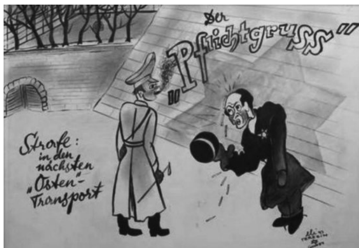
Obr. – 15 „Povinné salutování.“ Trest: deportace příštím transportem na východ.