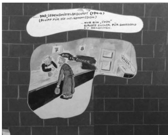
Obr. 20 – „Obchod s potravinami“ (1944) – klamání Komise Mezinárodního Červeného Kříže ... pouze „cvok“ (hlupák) věřil, že by mohl za ghetto-peníze dostat cukr; Prosim, 1 kg cukru.

Přípravy na návštěvu Komise Mezinárodního červeného kříže (23. 6. 1944) začaly brzy na jaře. Počátkem května byly poslány z Terezína na východ dva transporty, byly v nich slepí, nemocní tuberkulózou a všichni, kteří by mohli pokazit pozitivní image města. Gymnázium, používané jako nemocnice, bylo vyklizeno a „přeměněno“ v synagogu, divadlo a kino ... na střeše gymnázia byla otevřena venkovní kavárna, ostatní drát kolem náměstí byl odstraněn a náměstí přeměněno v park s hudebním altánem, restaurací atd. Po náměstí jezdily koňské povozy.