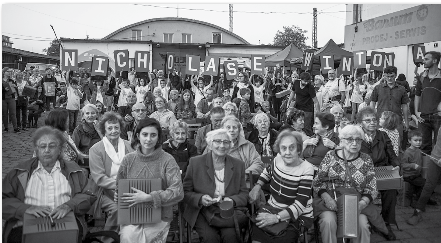
Symbolické pojmenování ulice Nicholase Wintona