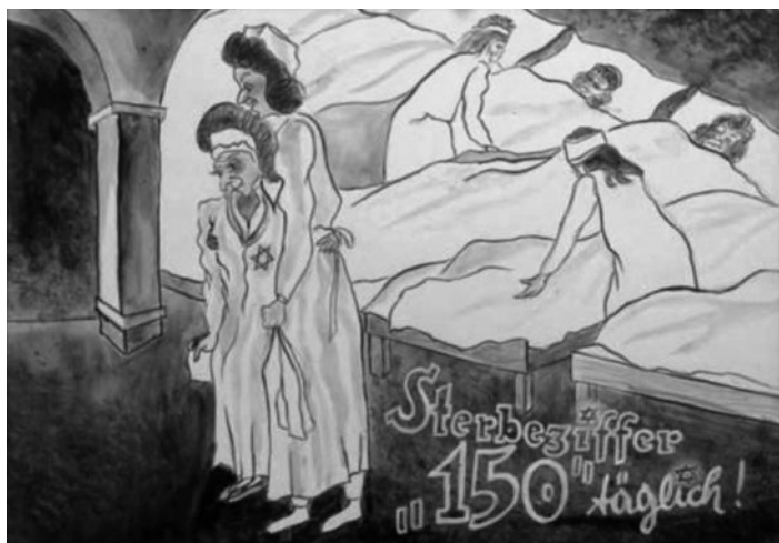
Obr. 14 – Denní úmrtnost: 150 Lesklého komentář: „Je to průjem, diarrhoea; říkalo se tomu „terezínka“. Nebylo volného místa: desetitisíce lidí na čtvereční kilometr. Nebyly k dispozici postele v nemocnicích, pouze pro privilegované. Já jsem ležel na podlaze měsíc.“