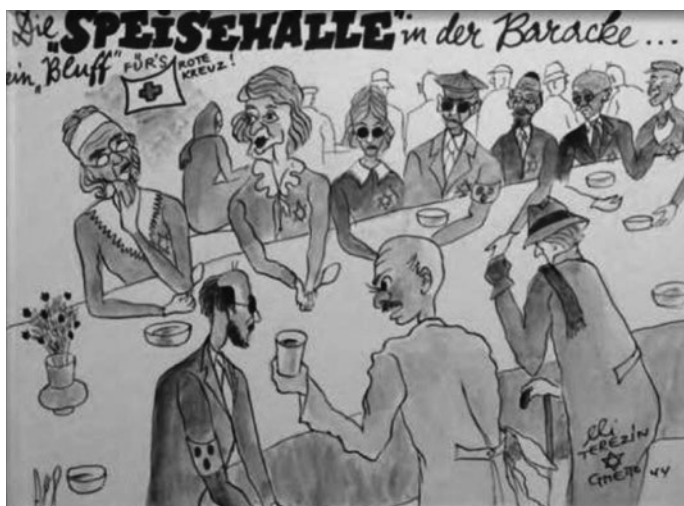
Obr. 22 – „Jídelní hala“ v barácích ... další bluf pro Červený kříž!

Erich a Eliška krátce po osvobození zrekonstruovali v Československu velkou část fragmentů obrázků, které se Eliška podařilo ukrýt mezi dřevěnými prkny v baráku. V r. 1949 manželé emigrovali do Izraele, později Erich znovu zachytil život v ghettu na obrazech větších velikostí.