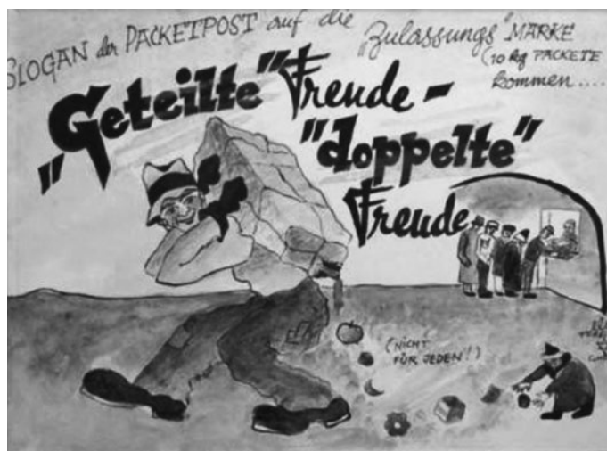
Obr. 23 – „Sdílená radost je dvojitá radost“, motto pošty na „známce-povolence“ (pro příchozí desetikilové balíky); (Ne pro každého!)

Erich a Eliška krátce po osvobození zrekonstruovali v Československu velkou část fragmentů obrázků, které se Eliška podařilo ukrýt mezi dřevěnými prkny v baráku. V r. 1949 manželé emigrovali do Izraele, později Erich znovu zachytil život v ghettu na obrazech větších velikostí.