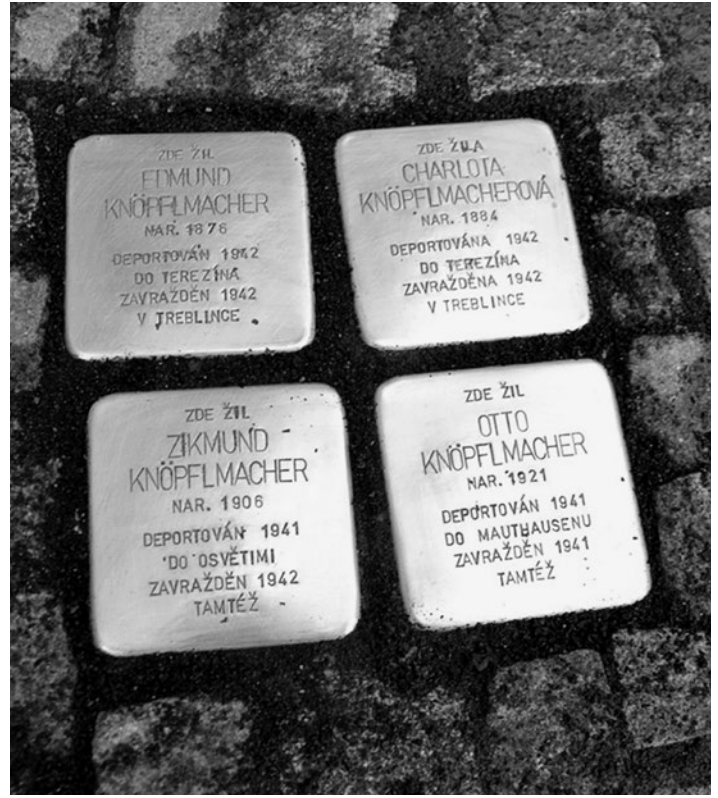
Stolpersteine rodiny Knöpfmacherových

Na mosazném štítu každé kostky je vyryto jméno oběti, datum narození a zatčení, jakož i datum a místo úmrtí. Pro každého člena rodiny se pokládá samostatný pamětní kámen. Jedná se o trvalou připomínku toho, co se stalo, a také je to