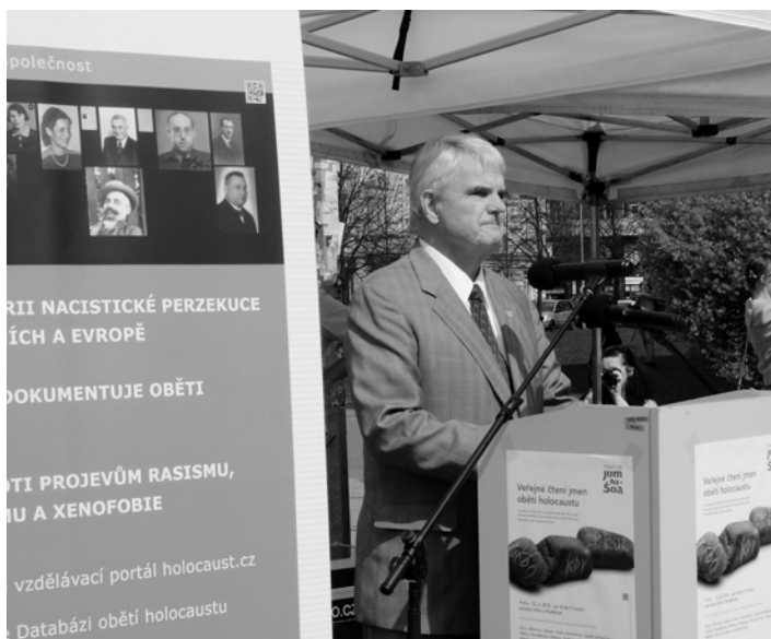
Stephen King, velvyslanec USA