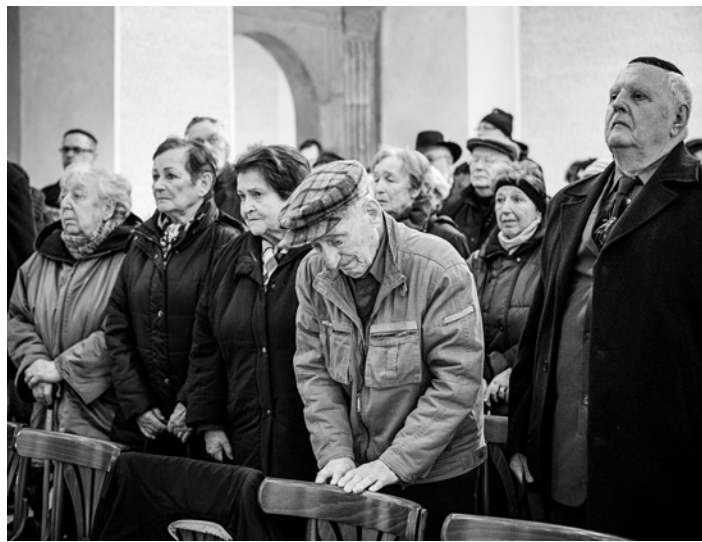
Minutou ticha jsme uctili památku všech obětí