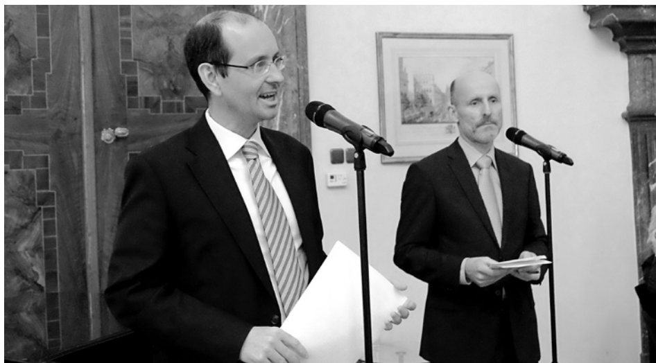
Velvyslanec SRN při zahajovacím projevu