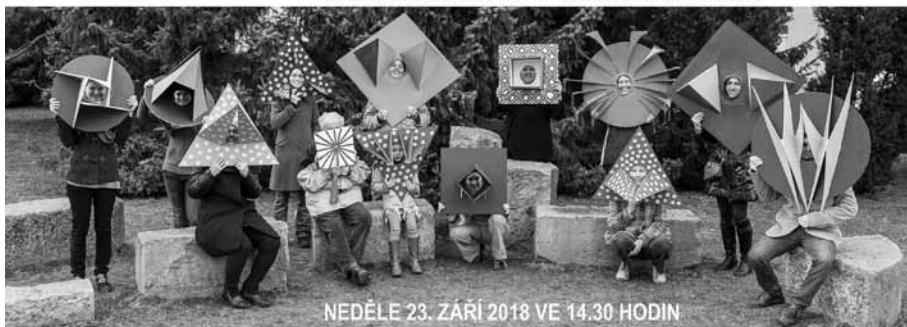
NEDĚLE 23. ZÁŘÍ 2018 VE 14.30 HODIN MUZEUM FOTOGRAFIE, KOSTELNÍ 20, JINDŘICHŮV HRADEC