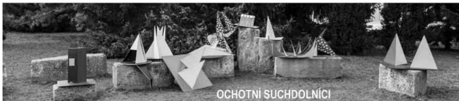
OCHOTNÍ SUCHDOLNÍCI DŘEVĚNÁ KRABIČKA – POHÁDKA Z TEREZÍNA