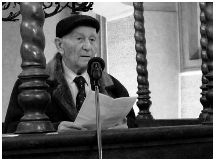
Pinkasova synagoga, březen 2012