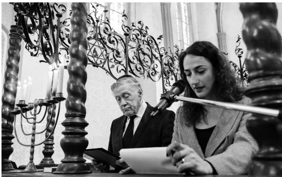
Herci Petr Kostka a Viktorie Hásková