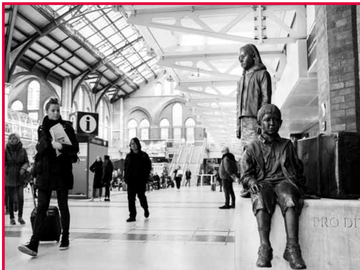
Pomník českých dětí na Liverpoolském nádraží v Londýně