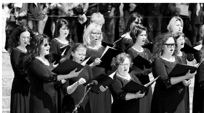
Děčínský pěvecký sbor

despektu, zavržení, jejímiž důsledky jsou kolektivní původ, vina i trest.“