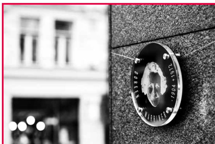
Pamětní deska na hotelu Alcron