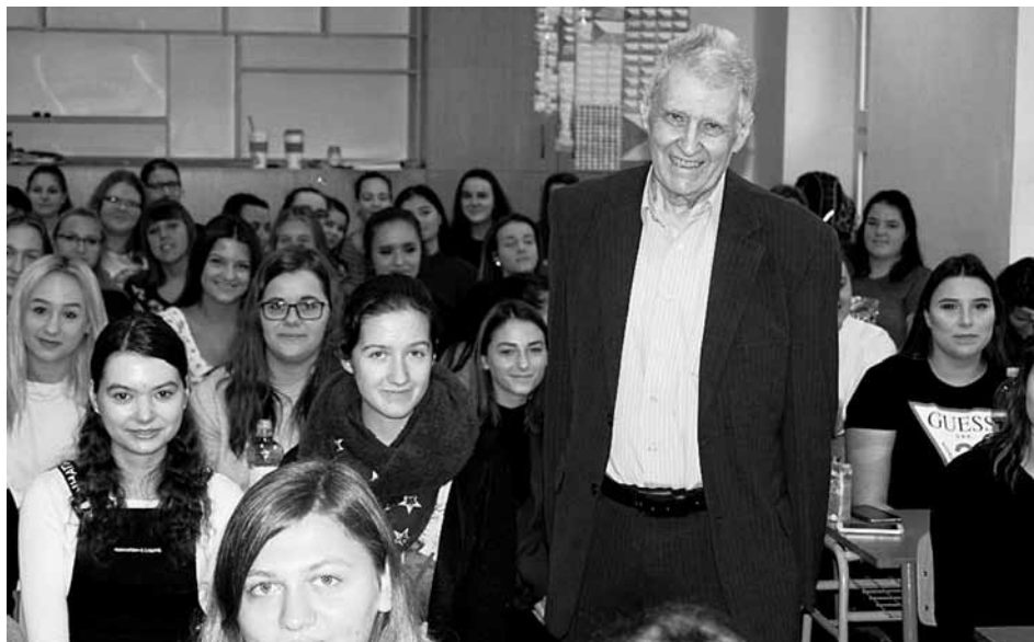
ZŠ Odry, listopad 2018, archiv J. Hlávkové

Šťastné dětství v dobře situované rodině strojího inženýra skončilo s okupací a vznikem protektorátu. Původní Eichmannův plán předpokládal vybudování