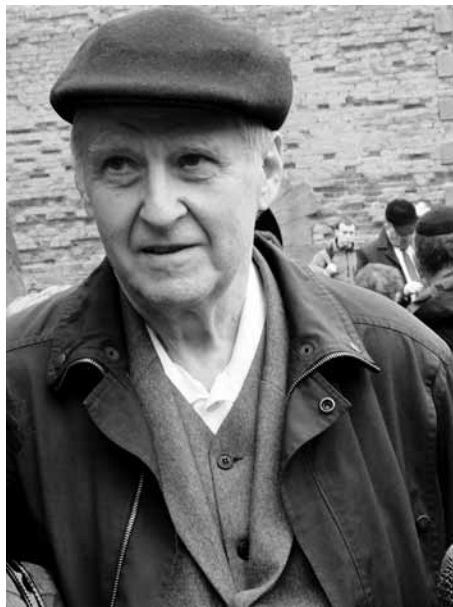
Terezín, říjen 2016

Nemám dar psaní a neumím ani dobře formulovat myšlenky, vzpomínky, které mi běhají hlavou. Vím jen, že když začnu vzpomínat, tak se mi derou slzy do očí. Ono přece jen 9 let je 9 let a za tu dobu jsme spolu prošli několika desítkami škol a udělali více jak stovku přednášek a nemám ani chuť to počítat, kolik jich přesně bylo, jen vím, že