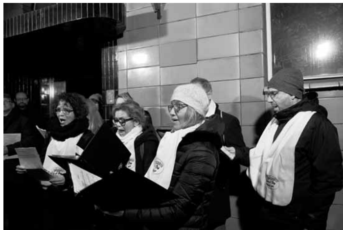
Pěvecký sbor Coro d'Oro

Jiná na důstojné označení ještě čekají. Kdo ulici (pod býv. názvem Strossmayerova) zadá do databáze obětí na www.holocaust.cz , objeví 33 jmen židovských obětí nacismu, kteří tu měli adresu (místo registrace). Právě v lednu 2020 se opět řešila budoucnost blízkého nádraží Praha-Bubny, z něhož byli za války deportováni Židé a po válce Němci. Od domu Farského 4 je vidět na Strossmayerovo náměstí, odkud pocházejí ikonické fotografie internovaných pražských Němců, jimž Češi namalovali hákové kříže nejen na kufry, ale i na obličej; ani poválečné utrpení německých civilistů v místním kině Oko dosud žádné označení nepřipomíná.