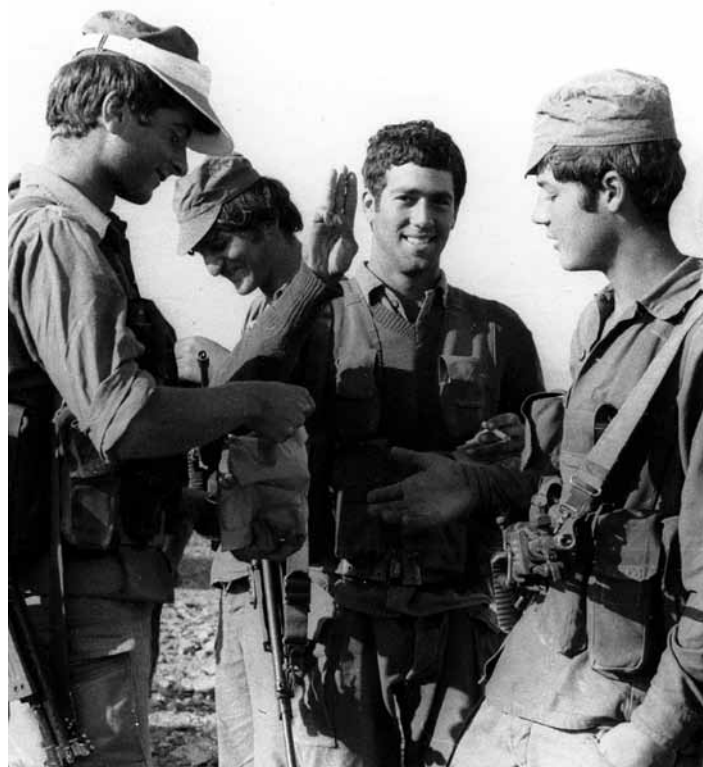
Vojáci před akcí v Entebbe