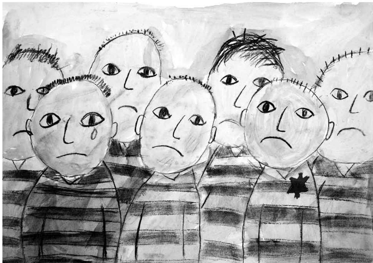
Kresba ze soutěže Památníku Terezín na téma: Jsem tu bez rodiny

Děkují kolegyním revizní komise za celoroční spolupráci. Členkám a členům Tereziánské iniciativy přeji, aby Tereziánská iniciativa pokračovala v dlouhodobě vytvářeně spolupodpoře.