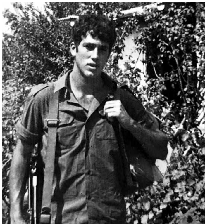
Jechiam jako voják

(Maně mi projede hlavou, jaký je to rozdíl – kdysi se jedni vymlouvali: „Vždyť jsme jen plnili rozkazy,“ tady hrdinové a tamti – zbabělci a zločinci. Ale tuhle myšlenku rychle zaženu!)