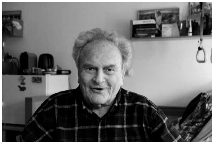
... a v prosinci 2019