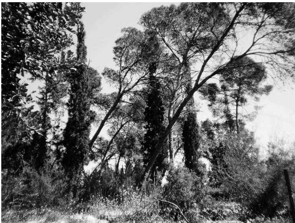
Masarykův les

Byl připraven večerní program i denní návštěva lesa, proslovy, naplánováno pohoštění, děti z kibucu měly připravené písničky, do Izraele přiletěla i skupinka břeclovských dobrovolníků. Jenže ouha! Mezitím propukl poprask s koronavirem. Jenže břeclovští přiletěli z Vídně a Rakousko bylo na seznamu nebezpečných zemí. Takže ani jejich koncert se nemohl konat a oni hned druhý den odletěli smutně domů. Zbyla tedy aspoň ekumenická mise, ovšem jejich zájezd měl nabitý program a na zastávku v Masarykově