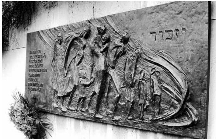
Pamětní deska

zpívaly role kočky a Aninky. Nezapomenutelné bylo setkání bývalých vězňů. Mnoho jich přijelo i ze zahraničí, o některých jsme ani nevěděli, že přežili. Bývalí spoluvězni se objímali, líbali, smáli se a plakali radostí i dojetím.