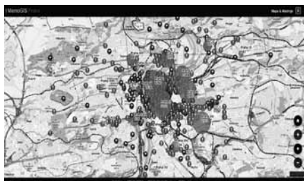
Náhled aplikace MemoGIS

Současně s výstavou byla představena také interaktivní aplikace, která je dostupná na adrese http://www.ehri.cz/memogis_cs.html . Zde se na mapě Prahy promítají informace a data k více než 30 000 obětem holocaustu, a také o místech, která byla za války židům zapovězena nebo na kterých došlo ke konfliktu v souvislosti s porušením některého, mnohdy absurdního, protizidovského nařízení. Mobilní webová aplikace tak umožňuje uživatelům zkoumat téma perzekuce Židů nejen z domácího či školního počítače, ale také přímo v prostoru města prostřednictvím mobilního zařízení.