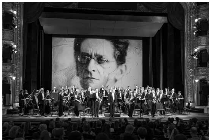
Z představení Zemlinsky 150, fragment z opery Malva, Alexander Zemlinsky