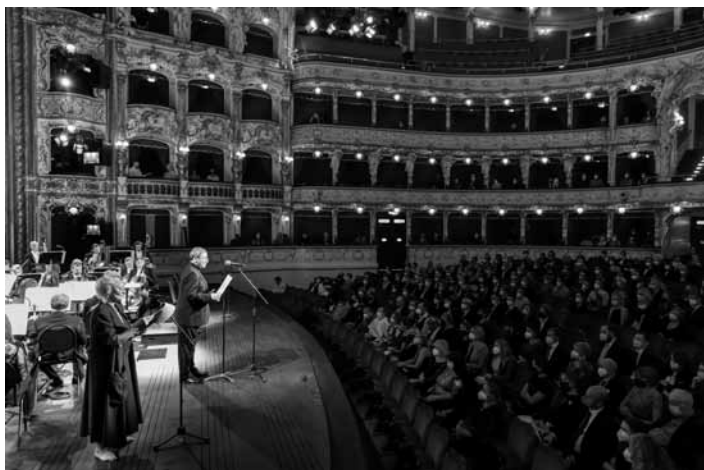
Vilma Cibulková a Tomáš Töpfer ve Státní opeře – 24. 10. 2021

V současné době se organizátoři plně věnují přípravám 5. ročníku festivalu plánovaného v termínu 15. února až 3. dubna 2022. Opět by se měl uskutečnit na různých impozantních místech Prahy, některé akce by pak mohly být uskutečněny i mimo hlavní město. Pro další informace sledujte stránky www.vecnanadeje.org nebo zamiřte na youtube kanál Věčná naděje, kde naleznete dva unikátní záznamy jarních koncertů, dokument o tzv. terezínských autorech i ukázkou z audioknihy Věčná naděje.