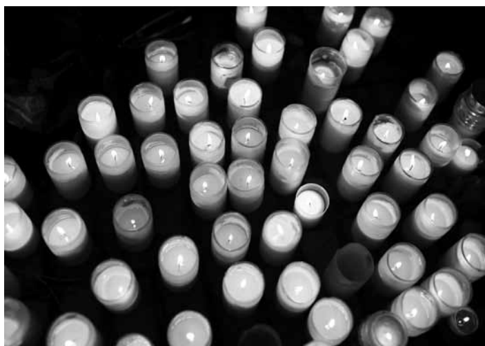
Hořící svíčky u železniční vlečky