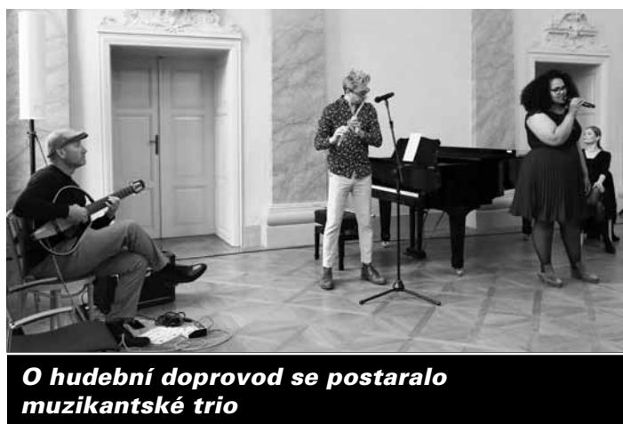
O hudební doprovod se postaralo muzikantské trio