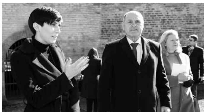
Markéta Pekarová Adamová a Wolfgang Sobotka

8. března 2022 byla v terezínském kolumbáriu odhalena pamětní deska na památku rakouských obětí terezínského ghetta. Desku odhalil v rámci své oficiální návštěvy ČR předseda Národní rady rakouského parlamentu Wolfgang Sobotka.