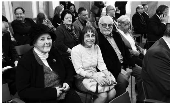
Delegace Terezínské iniciativy