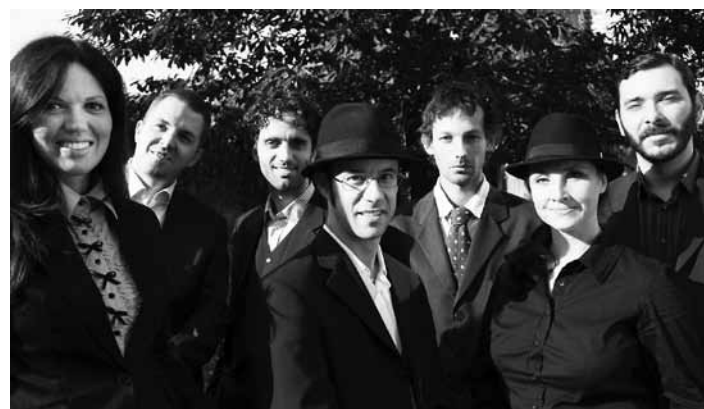
Pressburger Klezmer Band

Historičtí klezmeři hrávali k tanci, při svatbách a dalších slavnostních příležitostech a životní příběhy těch nejslavnějších z nich poutají dodnes, stejně jako klezmerová hudba.