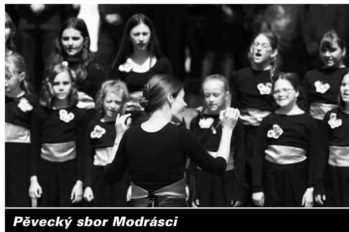
Pěvecký sbor Modrásci