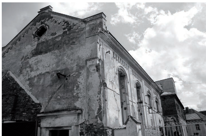
Pacov – synagoga

When Memory Meets Art כיצד זכרון פוגש אמנות