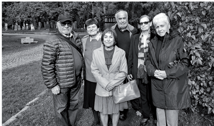
Delegace na Novém židovském hřbitově