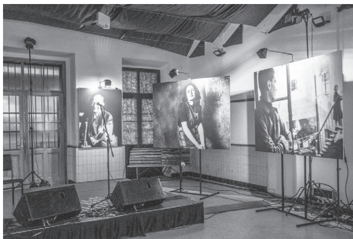
Výstava Album G. T.