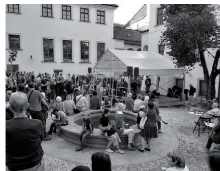
Nádvoří Staré radnice