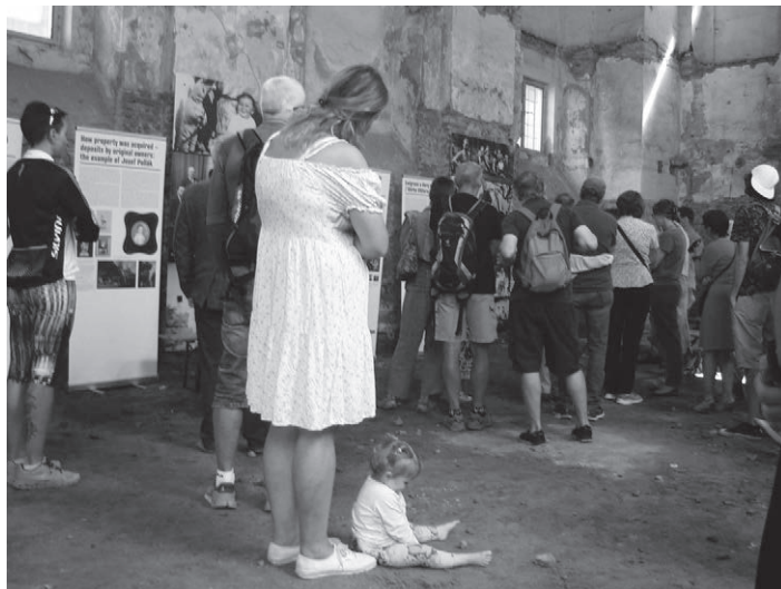
Synagoga v Pacově

A práce nekončí – nejbližší akcí bude třídní program v listopadu věnovaný 80. výročí deportací. V závislosti na finančních zdrojích bude pokračovat stavební činnost. Skutečně obdivuji obětavou činnost všech, kteří se podílejí, ať už