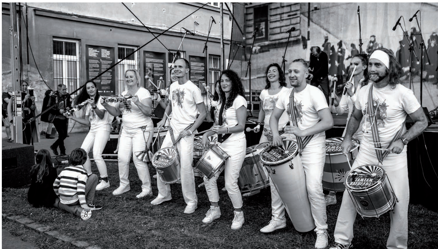
Tam Tam Batacuda