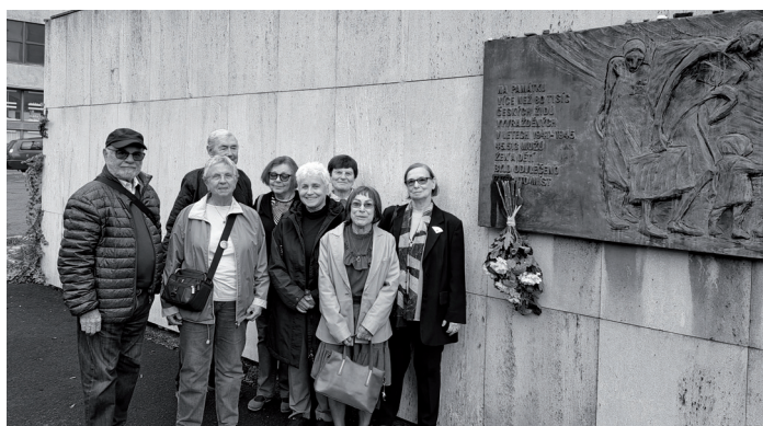
U pamětní desky na zdi holešovického hotelu