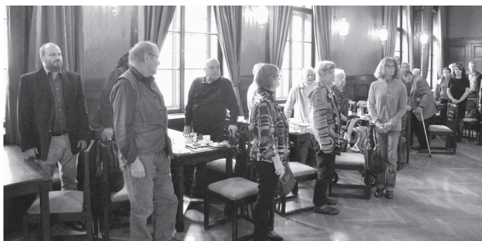
Chvilkou ticha jsme uctili památku zesnulých členů TI

Za celých 32 let, kdy existuje Terezínská iniciativa, navštívil Terezín nespočet školní mládeže. V průměru jde o třídy z 60–70 škol ročně. Zájezdy žáků a studentů však vyžadují spoustu finančních prostředků, které získáváme pomocí dotací. Největším naším donátorem je Nadační fond obětem holocaustu.