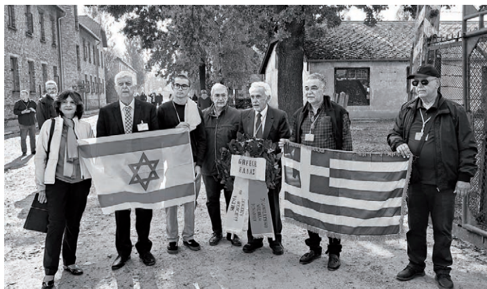
Izraelská a řecká delegace se „vyzbrojily“ vlajkami