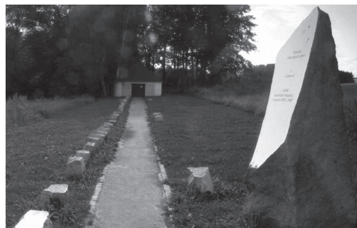
Černovice – památník obětem

organizačně, finančně či ideově, na uchování vzpomínky na židovskou minulost i na obnově židovských památek, které by jinak propadly zničení a zapomnění.