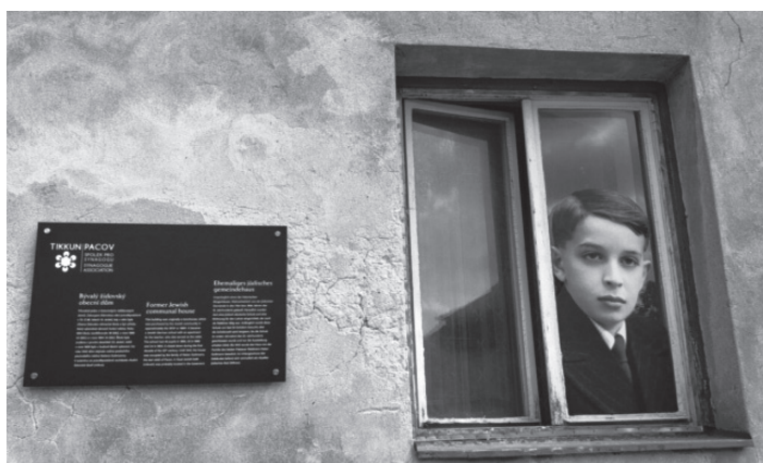
...z oken vyhlížejí fotografie povražděných dětí