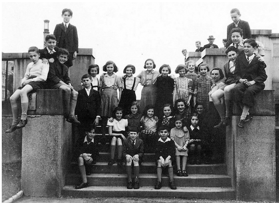
Třída P. Ginze na výletě (5. třída, školní rok 1938/39). K mému překvapení třída P. Ginze byla asi mámina třída. Bylo jí třiatdvacet a od září 1936 už měla vysvědčení učitelské způsobilosti pro obecné školy. Stojí vpravo mezi dětmi.

Proč vlastně šla máma už v roce 1937 učit do Židovské školy? Asi pod vlivem přátel. Byla jich spousta. A hodně zajímavých. Zdá se mi, že ostatně, jako skoro každý, prožívala po maturitě nejpestřejší léta svého života: studium a absolutorium na Filozofické fakultě UK, dlouhá cesta do Francie s delegací studentů, podpora demokratického Španělska... Ale proč nenapsat víc? Narodila se v roce 1915