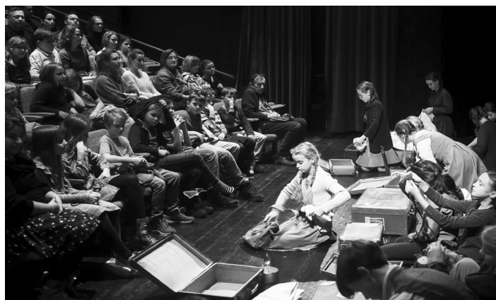
... a bolelo nebe