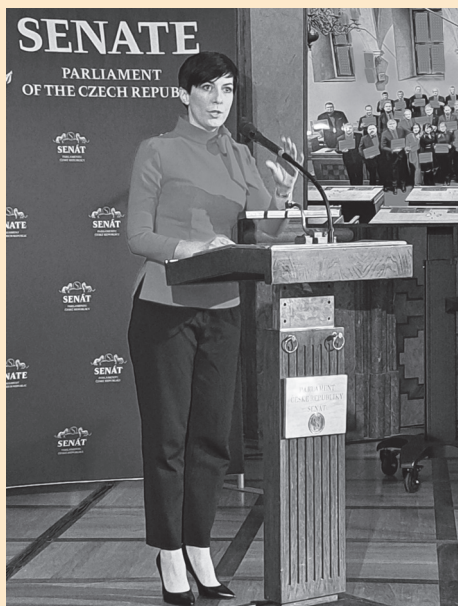
Markéta Pekarová Adamová