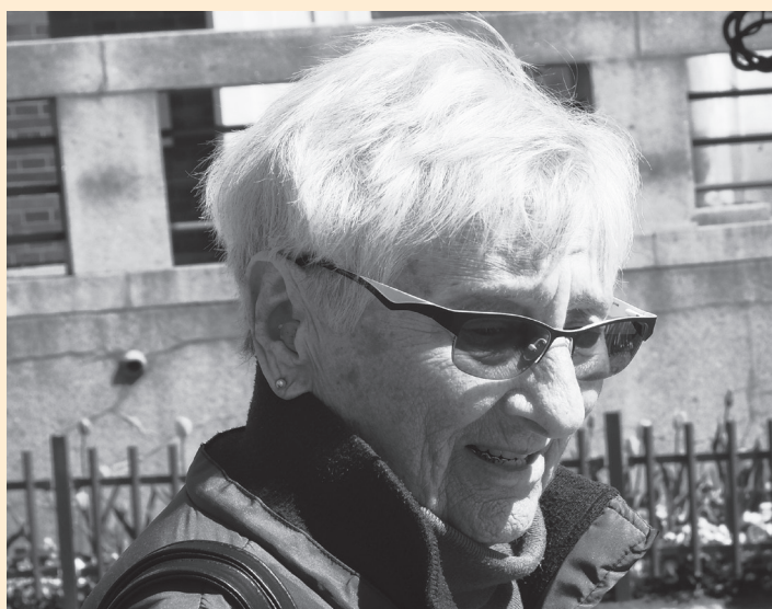
Duben 2017

V paměti mám mnoho historek, o několik se s vámi podělím. Některé znám z vyprávění, jiné jsem zažila. Před válkou