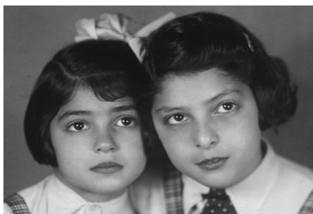
z dubna 1942

A mámino vyznání z 6. 11. 1944: „Pracuji teď s dětmi, jako kdysi v dávné minulosti, kdy mojí jedinou starostí a ctižádostí byla škola a rande s Tebou. Tou intenzivní prací s dětmi se mi ta dávno uplynulá doba, vlastně svým způsobem šerý dávnovek, tak zpřítomnila, že mi připadá, jako by to bylo včera, kdys mně chodil na Staré Město naproti, a kdy jsme chodívali do Mánesa či Lumíru. Mám dojem, že řada lidí spolu nezažila za celý život tolik, jako my dva za relativně krátkou dobu. Ačkoli ode dneška za měsíc budeme vlastně slavit 8 let, miláčku, víš to?“