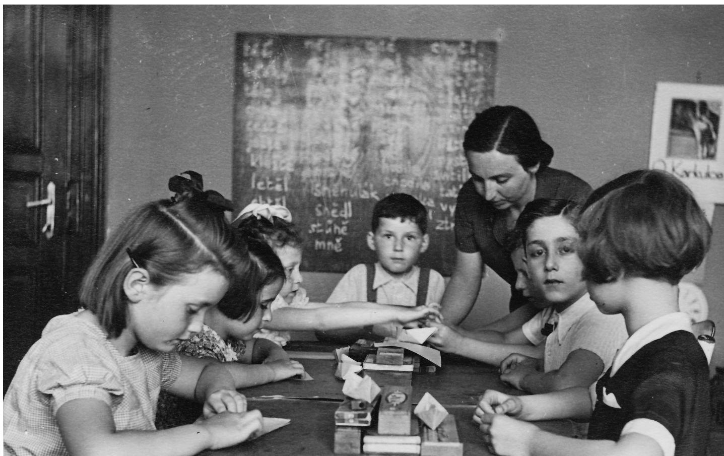
„Třída s tabulí“ v Pobřežní 2 (červen 1941)