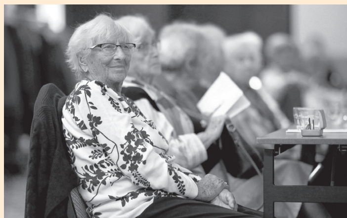
Říjen 2021