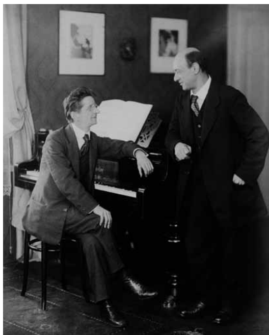
Alexander Zemlinsky a Arnold Schönberg na snímku pořízeném v Praze v roce 1917.

Více informací o obou projektech a vstupenky on-line naleznete na stránkách www.musicanongrata.cz .