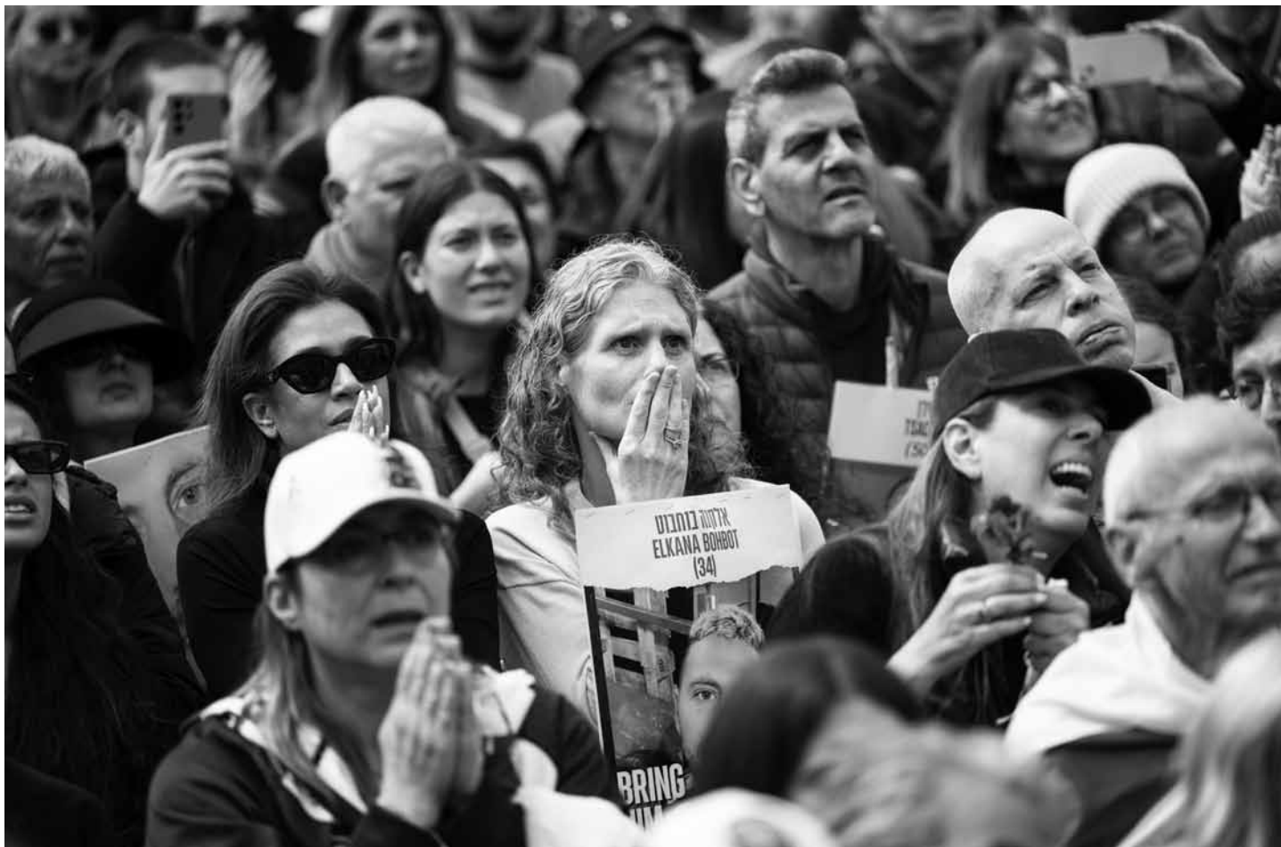
Pláč se střídá s euforií