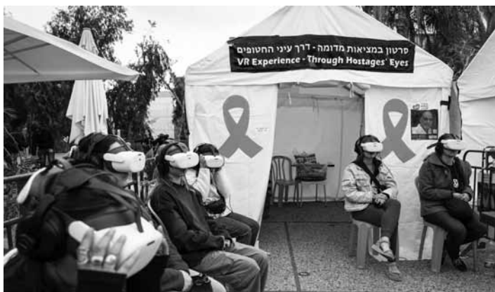
3D brýle simulují věznění rukojmích v Gaze

Na Náměstí rukojmích stojí stánek, kde si lze volně zapůjčit 3D brýle a prostřednictvím filmu se ve virtuální realitě přenést do jednoho z modelových gazanských úkrytů, kde teroristé unesené lidi drží. Virtuální prostředí je autentické, vzniklo na základě výpovědí již propuštěných. Divák se ocitá v tmavé kobce, zblízka na něj zírá terorista z Hamásu a řve co-si arabsky. Chvějící se uvězněná matka vedle drží v rukou plačící mimino, s každým dalším vzlykem roste ve vězniceli