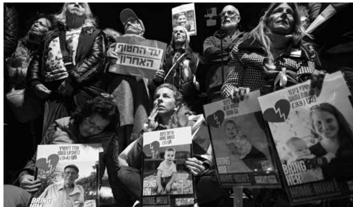
Stále v očekávání

kamery snímají první objekty osvobozených vězňů s rodiči a partnery, všichni společně pak nasedají do vojenské helikoptéry, jež s nimi o patnáct minut později přelétává nad Náměstím rukojmích do telavivské nemocnice. Dav jejím pasažérům mává, lidé se radují a pláčou současně. Tento okamžik štěstí je zároveň možná na dlouhou dobu poslední. Propuštěním této šestice totiž končí prozatím dohodnuté výměny živých rukojmích a panuje obava, co bude následovat.