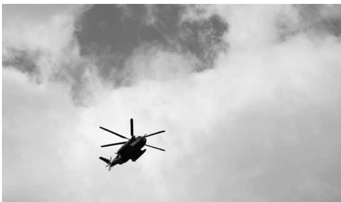
Helikoptéra s právě propuštěnými 6 rukojmími

O dva dny později střídá žal radost. V sobotu 22. února se od brzkého rána začínají lidé scházet na náměstích po celé zemi, aby společně u velkých televizních obrazovek sledovali návrat šesti přeživších rukojmích, kteří v podzemních kobkách kdesi v Pásmu Gazy strávili 505 dní, dva z nich dokonce více než 10 let. Dnes je radost o to větší, že se teroristé rozhodli pustit na svobodu místo každý týden obvykle tří unesených jejich dvojnásobný počet. Hlavním dějištěm smutku i momentálních oslav je náměstí před telavivským Muzeem moderního umění, které se krátce po únosu stalo centrálním místem všech událostí spojených s rukojmími. Začalo se mu říkat Náměstí rukojmích a je polepené fotkami rukojmích. „Dostaňte je domů hned,“ je napsáno pod každou jednotlivou tvář, čímž rodiny unesených vyzývají vládu premiéra Benjamina Netanjahua, aby jejich milované zachránila okamžitě stůj co stůj. Šestice právě překročila hranice s Gazou, kde si je od zástupců Mezinárodního červeného kříže přebírá izraelská armáda. Dokumentární