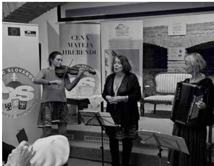
Dámské trio Nešama

Film mimo jiné napomáhá a je také využíván k osobnostnímu rozvoji a tvoření postojů dětí (ideálně ve věku 7–15