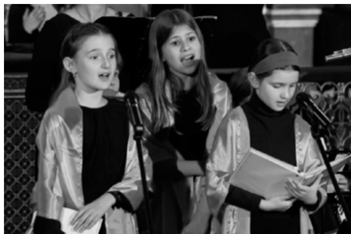
Děti z Lauderek

Už řadu let se pravidelně účastním koncertů Světlo porozumění ve Španělské synagoze. Nedovedu říct proč, ale loňský koncert byl čímsi výjimečný, převyšoval předchozí ročníky a rozhodně patřil k velice silným zážitkům, kterých se dostalo nejen mně, ale zcela určitě i všem přítomným posluchačům. A tak s vděkem organizátorům, těším se na letošní listopad.