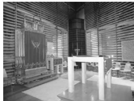
Modlitebna nové liberecké synagogy s áron ha-kodeš a bímou

byl výrazně ovlivněn moderním pojetím židovské tradice. Zlomem byl rok 1938, kdy téměř všichni Židé odešli do vnitrozemí nebo emigrovali z Československa. Během tzv. Křišťálové noci byly vypáleny významné synagogy v Liberci, Jablonci nad Nisou i v České Lípě.