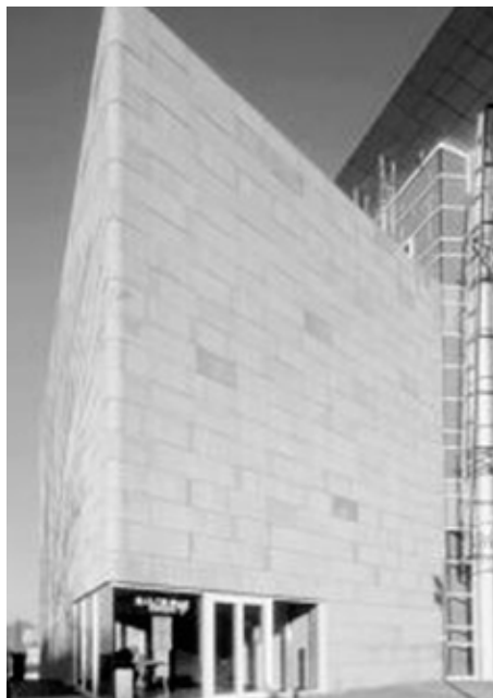
Nová liberecká synagoga z r. 2000