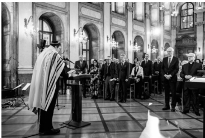
Kantor Rafael Rod přednesl modlitbu za duše zemřelých El male rachamim.