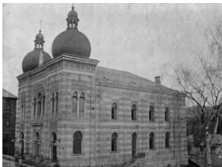
Synagoga v Jablonci n. Nisou z r. 1892, vypálená v r. 1938