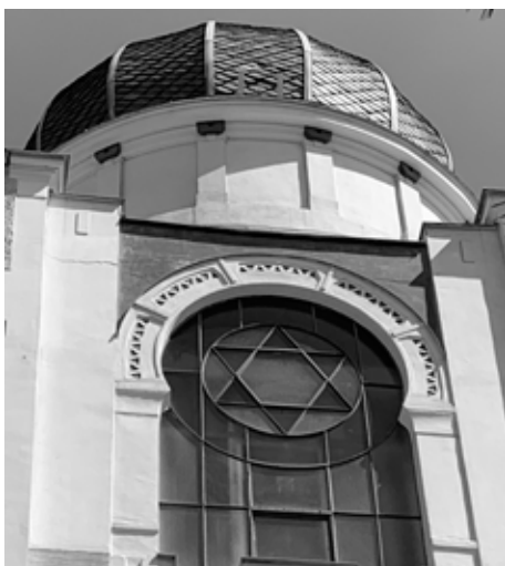
Synagoga v Děčíně