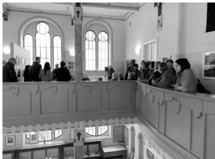
Vernisáž v synagoze