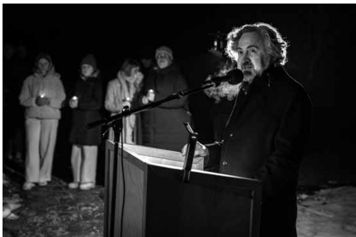
Jan Hřebejk, režisér